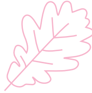
Bois de chêne